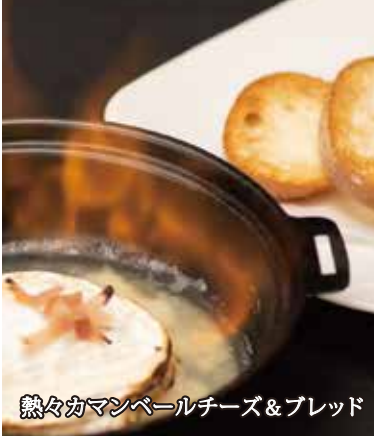
熱々カマンベールチーズ&ブレッド