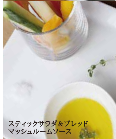
スティックサラダ&ブレッド マッシュルームソース