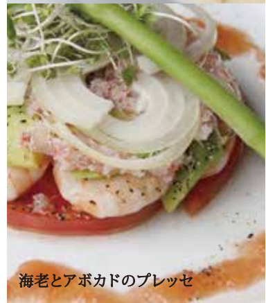
海老とアボカドのプレッセ