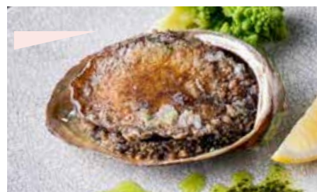
薪焼き鮑のグリルステーキ wood-grilled Abalone steak 8,500 (税抜) 9,350 (税込)