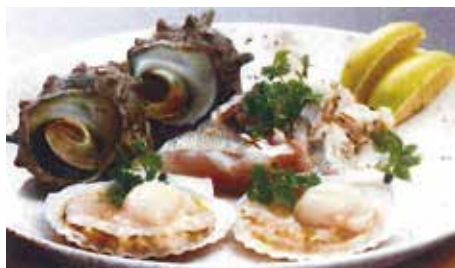
薪焼き本日の玄海産海の幸グリル (2名様~) Today's Genkai Sea seafood, wood-grilled (Two orders minimum) 2名様：3,600 (税抜) 3,960 (税込) 3名様：5,400 (税抜) 5,940 (税込) 4名様：7,200 (税抜) 7,920 (税込)