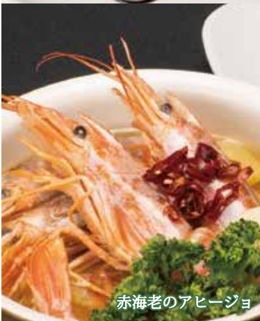
赤海老のアヒージョ