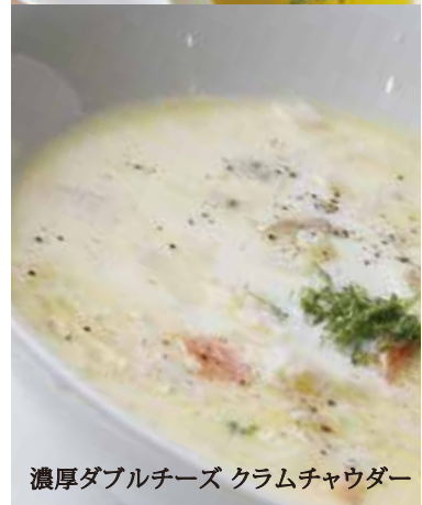
濃厚ダブルチーズ クラムチャウダー