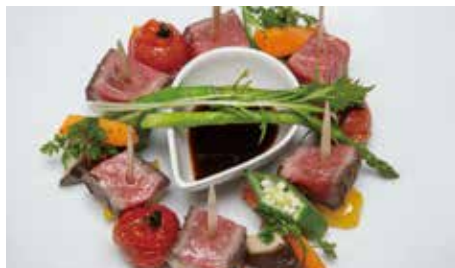
ヒレにんにくのピンチョス ~少しステーキを食べたい方へ teak Fillet and Garlic Pinchos For those who want to eat a little steak 2,200 (税抜) 2,420 (税込)