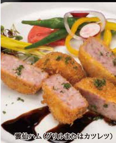
雲仙ハム (グリルまたはカツレット)