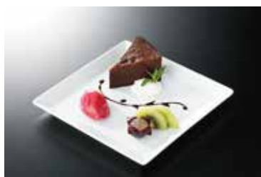
手作りガトーショコラ Handmade Gateau Chocolat