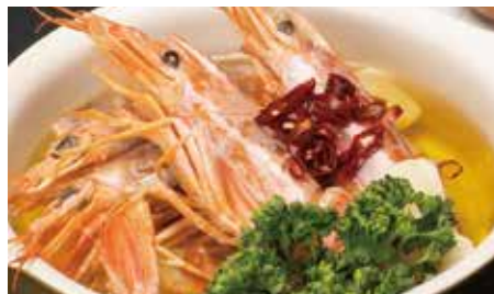
赤海老のアヒージョ red shrimp Ajillo 1,800 (税抜) 1,980 (税込)