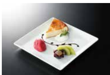
手作りチーズケーキ Handmade cheesecake