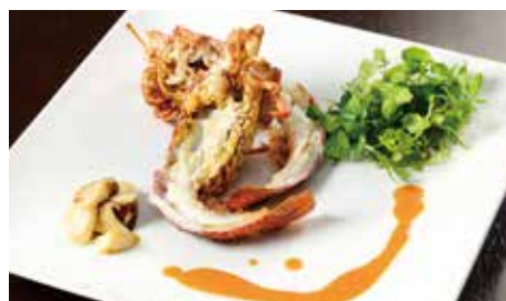
薪焼きロブスターのグリル wood-grilled Lobster 6,500 (税抜) 7,150 (税込)