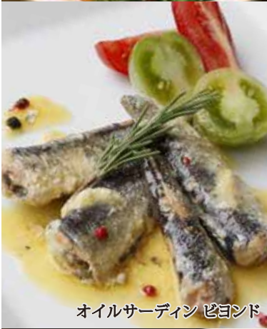
オイルサーディン ビヨンド