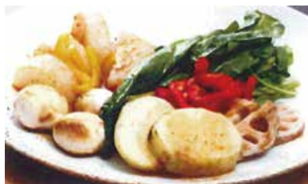
薪焼き若松オーガニックのおまかせグリル (2名様~) Assortment of wood-grilled Wakamatsu vegetables (Two orders minimum) 2名様：1,500 (税抜) 1,650 (税込) 3名様：2,250 (税抜) 2,475 (税込) 4名様：3,000 (税抜) 3,300 (税込)