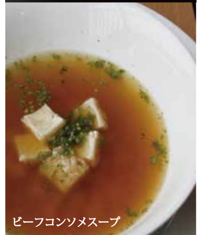
ビーフコンソメスープ